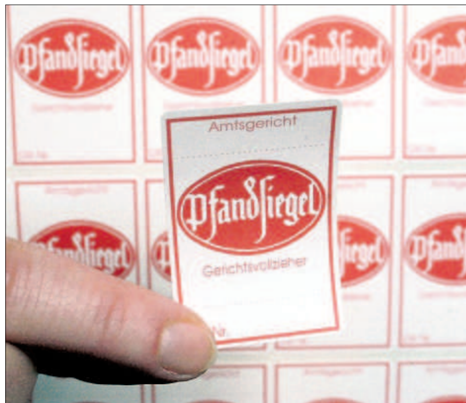
Das Kuckuck genannte Pfandsiegel dokumentiert seit etwa 100 Jahren die Beschlagnahme eines Wertgegenstandes durch das Gericht.

Geht es um kleine Beträge, können die Vollstreckungskosten das Mehrfache der ursprünglichen Schuld ausmachen. Zunächst ist der gegnerische Anwalt zu zahlen. Wie viel das ist, hängt vom Streitwert ab, also dem geschuldeten Geld. Der Gerichtsvollzieher wiederum berechnet für praktisch jeden Handschlag eine festgelegte Gebühr: für die Zustellung,